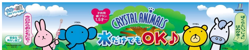
No.20 H120×W600 (エンド600サイズ)