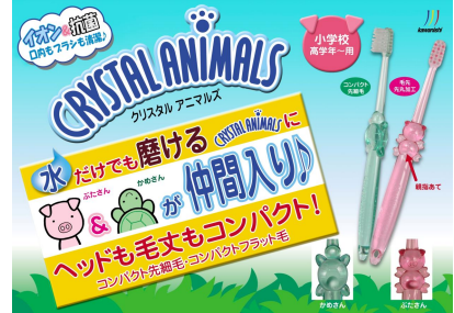
No.10 H200×W280 (A4サイズ)