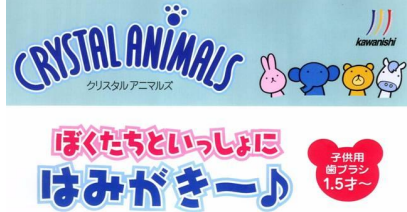
No.4 H410×W280 (A3サイズ)