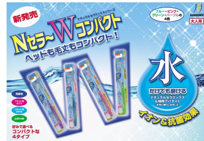
No.15 H200×W280 (A4サイズ)